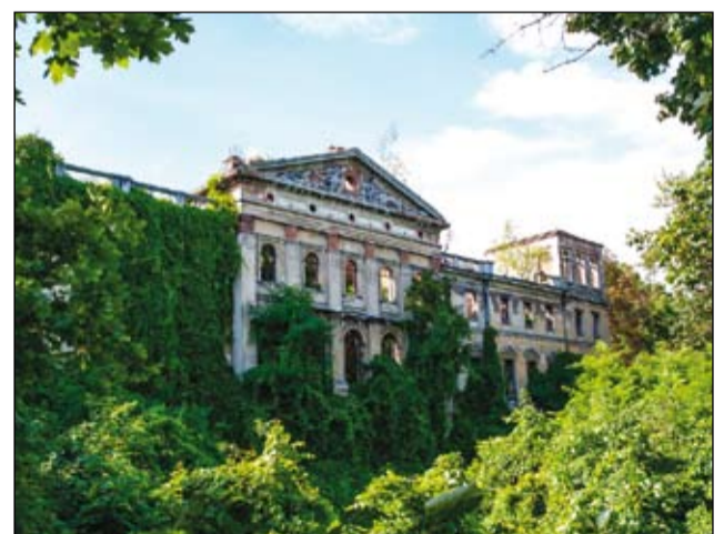
Historický zámek v místě Slawików je možné získat za cca 300 tis. PLN.

Je to vůbec poprvé, kdy obec takovým rozhodným způsobem přistoupila k otázce prodeje „perly Slawikowa“. Radní deklarují, že budou budoucímu majiteli nápomocni při získávání finančních prostředků z unijních zdrojů, jestliže se nabyvatel bude zajímat o takovou formu získání peněz potřebných pro obhospodařování objektu a přilehlých parcel.