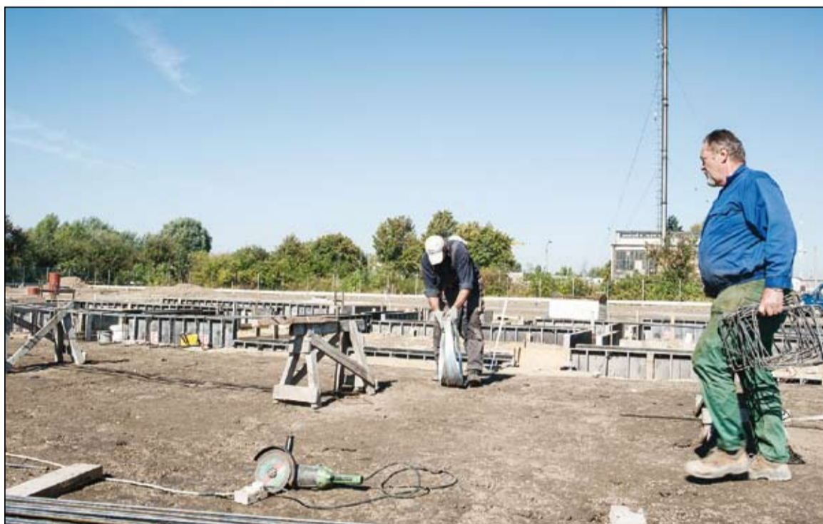
Parcely průmyslové zóny jsou připravovány tak, aby splňovaly požadavky investorů.

Největší výhodou investování v zóně jsou daňové úlevy na dani z příjmu přiznávané na období něko-