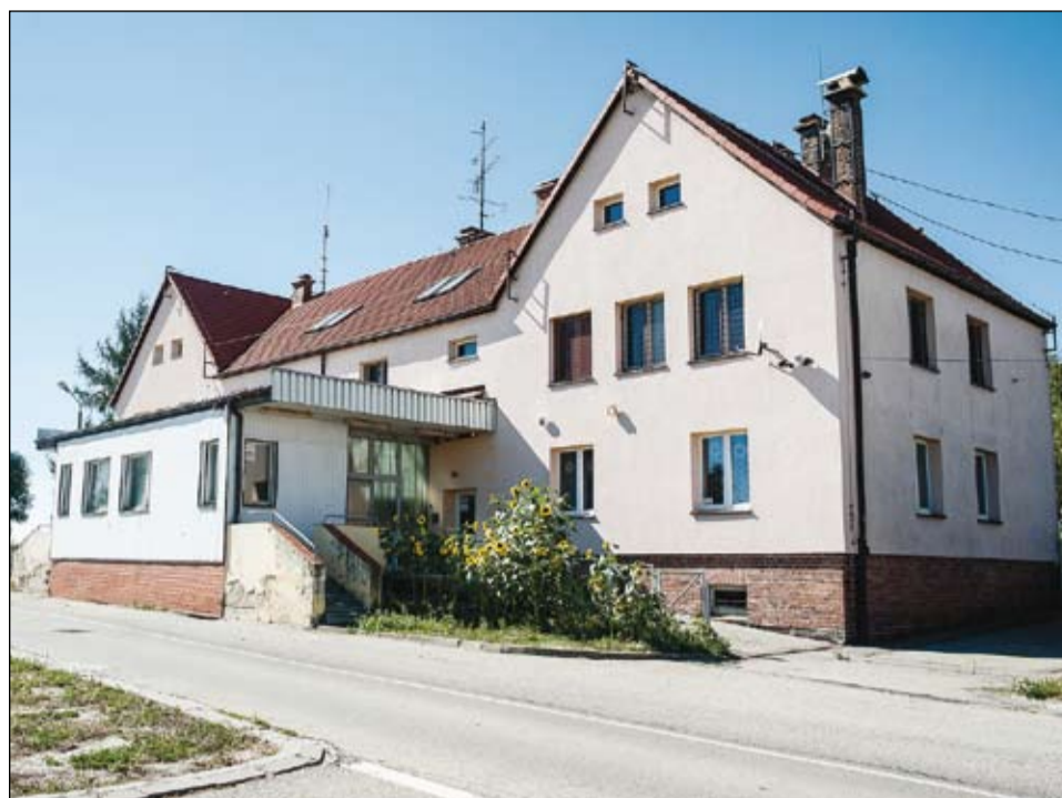
Bývalé zázemí pohraničnicků poblíž hranice je ve výborném stavu, náklady na opravy by zde byly minimální.