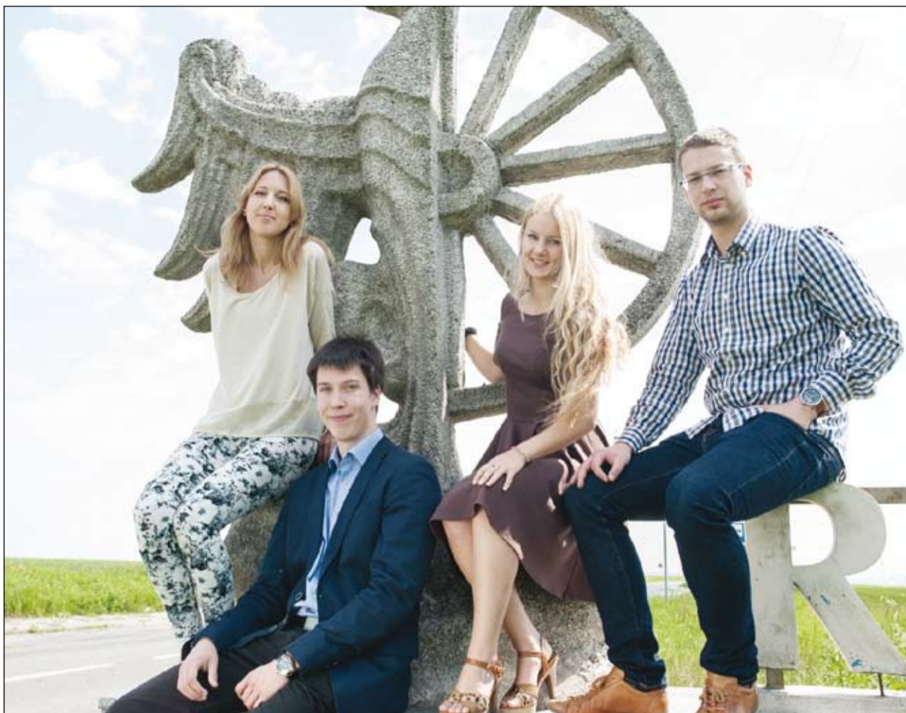
Ratiboř má výborně vzdělané mladé obyvatele.

V Ratiboři najdeme vysokou koncentraci dobře vzdělaných kádrů se silnou tradi-